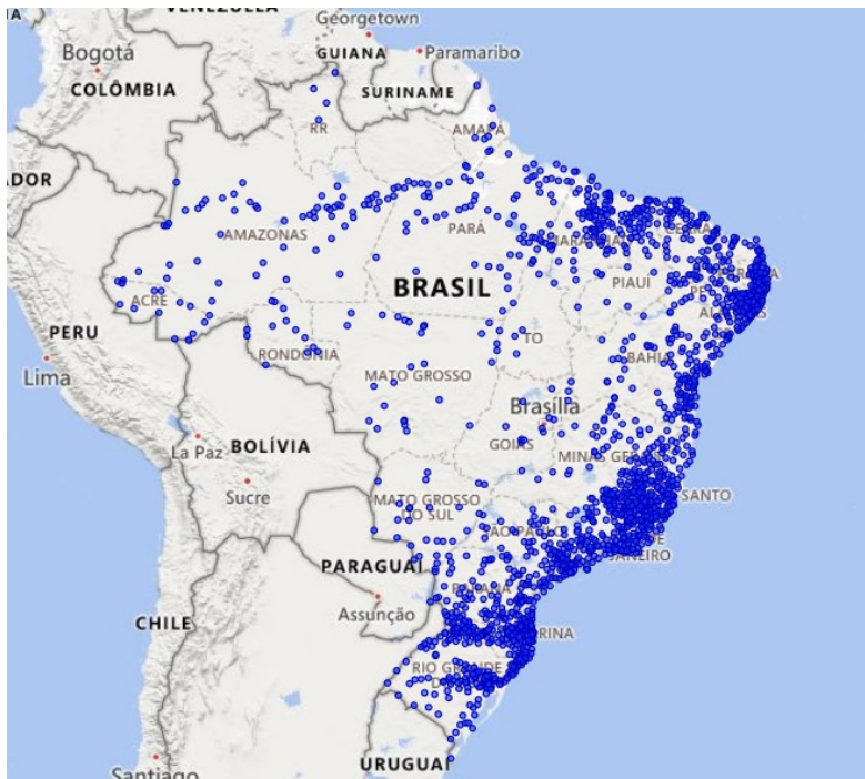
Figura 5 – Localização dos 1.813 municípios com 96,5% de registro de desabrigados e desalojados decorrentes de desastres naturais (Fonte: Elaboração própria).