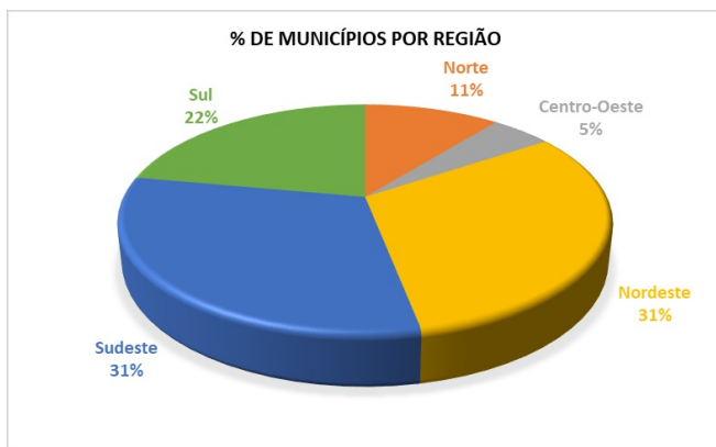
Figura 2 – Percentual de municípios mais suscetíveis a ocorrência de deslizamentos, enxurradas e inundações, por região.

37. Considerando a Tabela 3 e a Figura 2, observa-se que a Região Sudeste concentra a maior população exposta aos riscos, tendo o estado de Minas Gerais o maior quantitativo de municípios mais suscetíveis a ocorrência de desastres naturais (283), seguido de São Paulo (172), Rio de Janeiro (75) e Espírito Santo (71). Na Região Sul, o estado de Santa Catarina desponta com o maior número de municípios (207) e pessoas expostas aos riscos, seguido do Rio Grande do Sul (142) e Paraná (80).