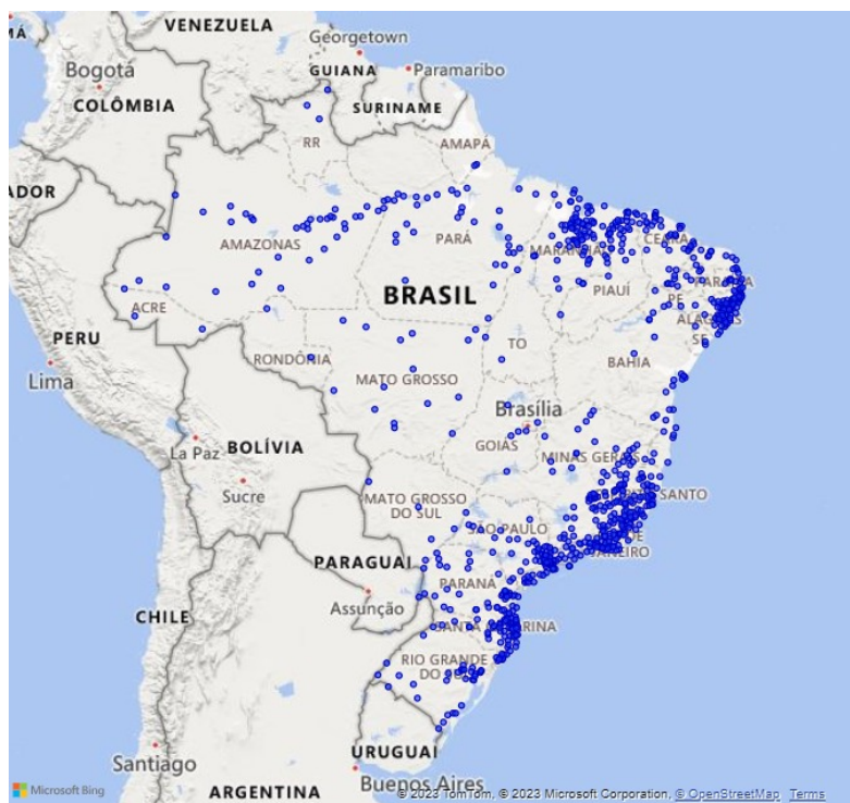
Figura 1 - Localização dos 821 municípios críticos que orientaram as ações do Programa Gestão de Riscos e Resposta a Desastres do PPA 2012-2015 (Fonte: Elaboração própria).

21. A seguir é apresentada a Figura 1, com a localização dos 821 municípios críticos de 2012 e a Tabela 1 com a distribuição por região e estado.