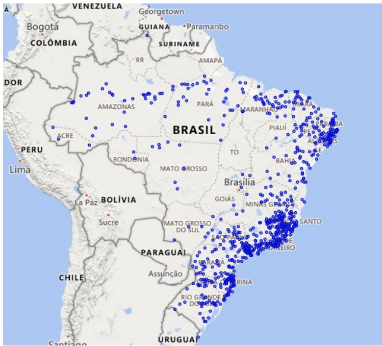
Figura 4 – Localização dos 739 municípios com 100% dos óbitos registrados decorrentes de desastres naturais.