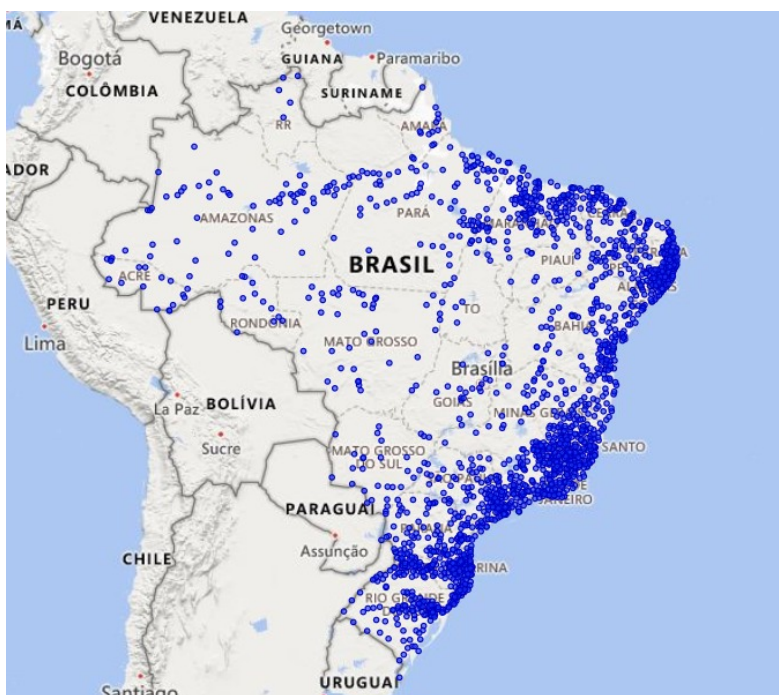
Figura 3 – Localização dos 1.942 municípios mais suscetíveis à ocorrência de deslizamentos, enxurradas e inundações.

40. Considerando a base de dados atualizada até 2022, foram gerados mapas com o auxílio da ferramenta Power Bi , a localização no território nacional dos 1.942 municípios mais suscetíveis (Figura 3).