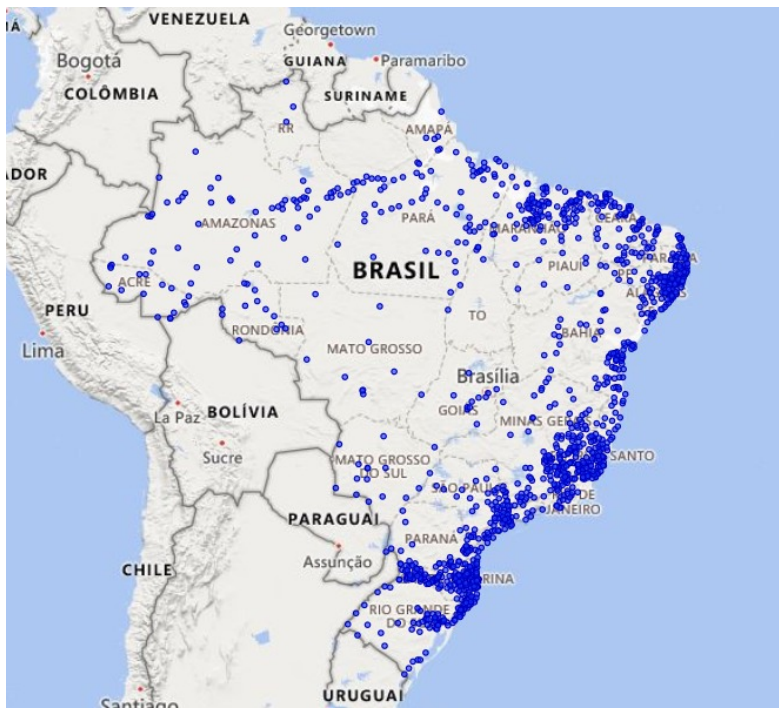
Figura 6 – Localização dos 1.256 municípios que registraram 99,5% das pessoas em áreas mapeadas com risco geo-hidrologicos.

42. Um painel de dados em Power BI foi desenvolvido e disponibilizado às entidades participantes das oficinas, a fim de auxiliar na escolha de seus critérios adicionais de priorização para aplicação em suas ações e programas (Figura 7).